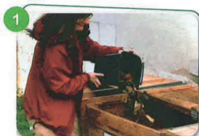
1 VIDEZ VOS BIODÉCHETS DANS LE BAC DE DÉPÔT