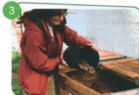
3 RECOUVREZ LES APPORTS AVEC LA MATIÈRE SÈCHE DISPONIBLE DANS LA RÉSERVE DE BROYAT