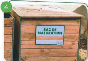
4 BAC DE MATURATION Ne rien ajouter dans ce bac, les décomposeurs travaillent pour vous! Vous pouvez l'utiliser une fois mûr

INFORMATION : Un compost mûr est caractérisé par un aspect homogène, une couleur brun foncé, une structure grumeleuse, fine et friable