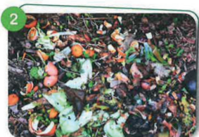
2 AÉREZ LA MATIÈRE Brassez la matière en mélangeant les nouveaux apports avec les plus anciens afin de favoriser la décomposition